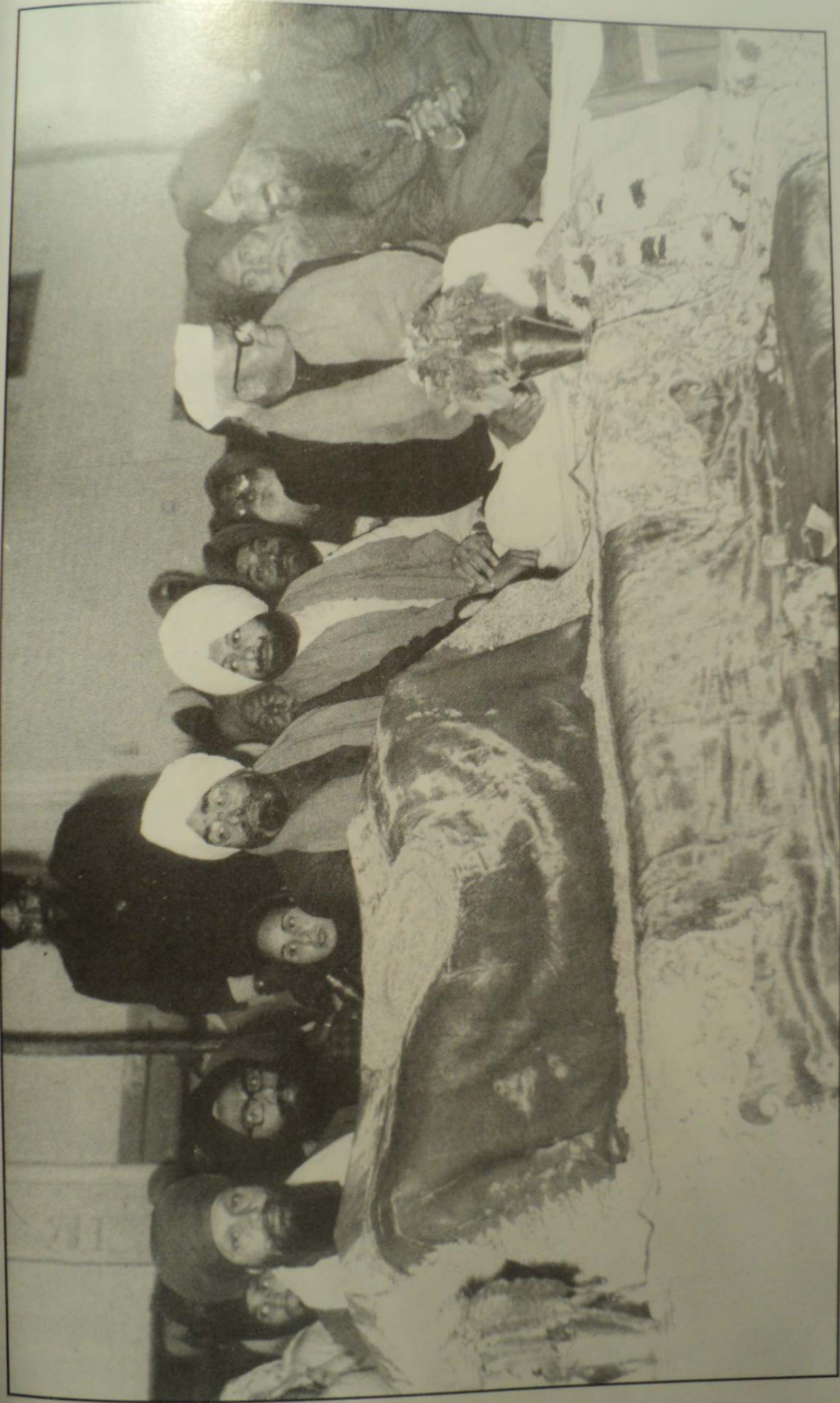
ਸ੍ਰੀ ਗੁਰੂ ਤੇਗ ਬਹਾਦਰ ਸਾਹਿਬ ਜੀ ਦੀ ਤੀਸਰੀ ਸ਼ਤਾਬਦੀ ਦੇ ਸੰਬੰਧ ਵਿਚ ਦਿੱਲੀ ਵਿਖੇ ਸਟੇਜ ਦਾ ਦ੍ਰਿਸ਼