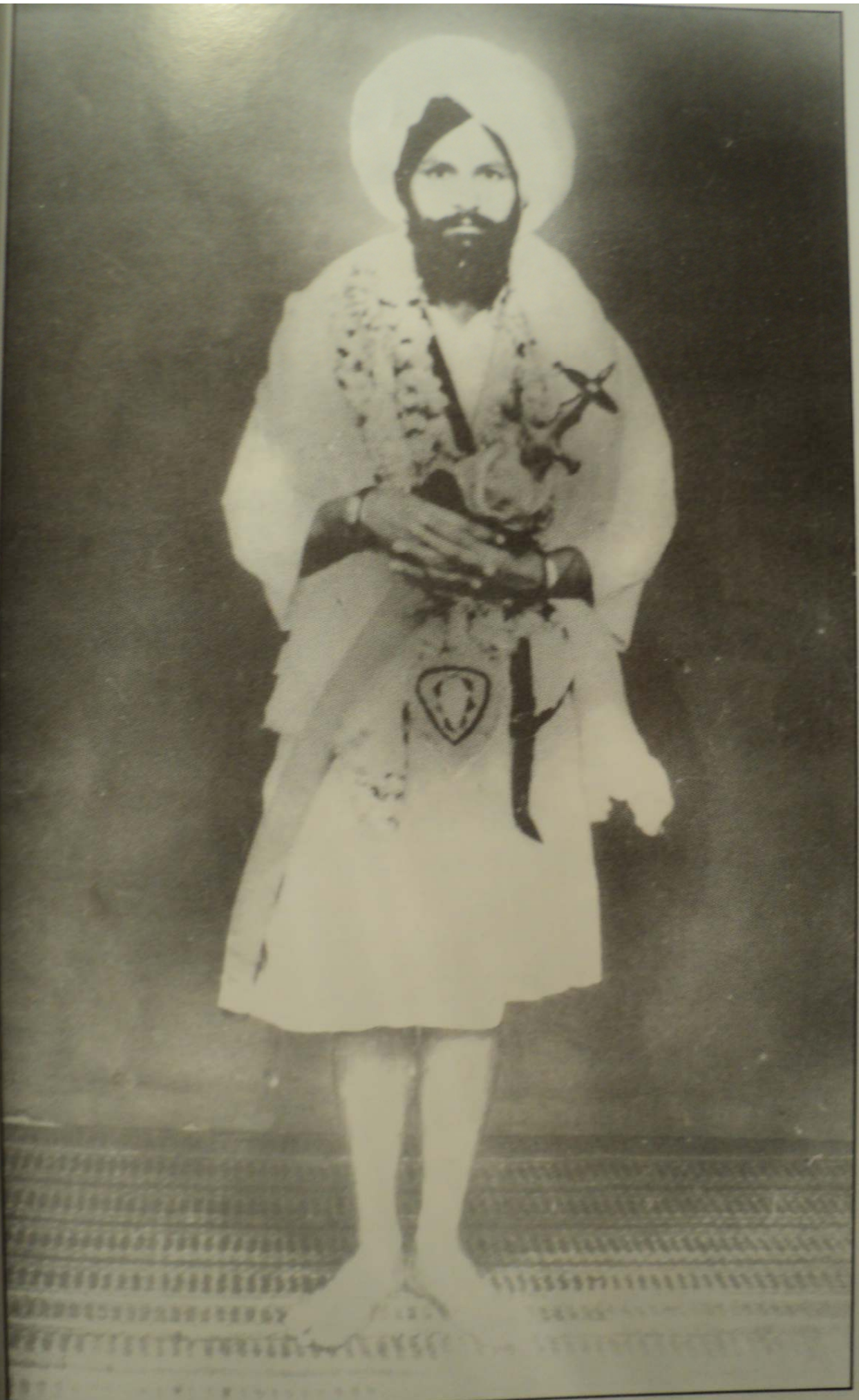
ਮਹਾਂਪੁਰਖ ਤਖ਼ਤ ਸ੍ਰੀ ਪਟਨਾ ਸਾਹਿਬ ਵਿਖੇ ਬਖਸ਼ਿਸ਼ ਤੋਂ ਬਾਅਦ