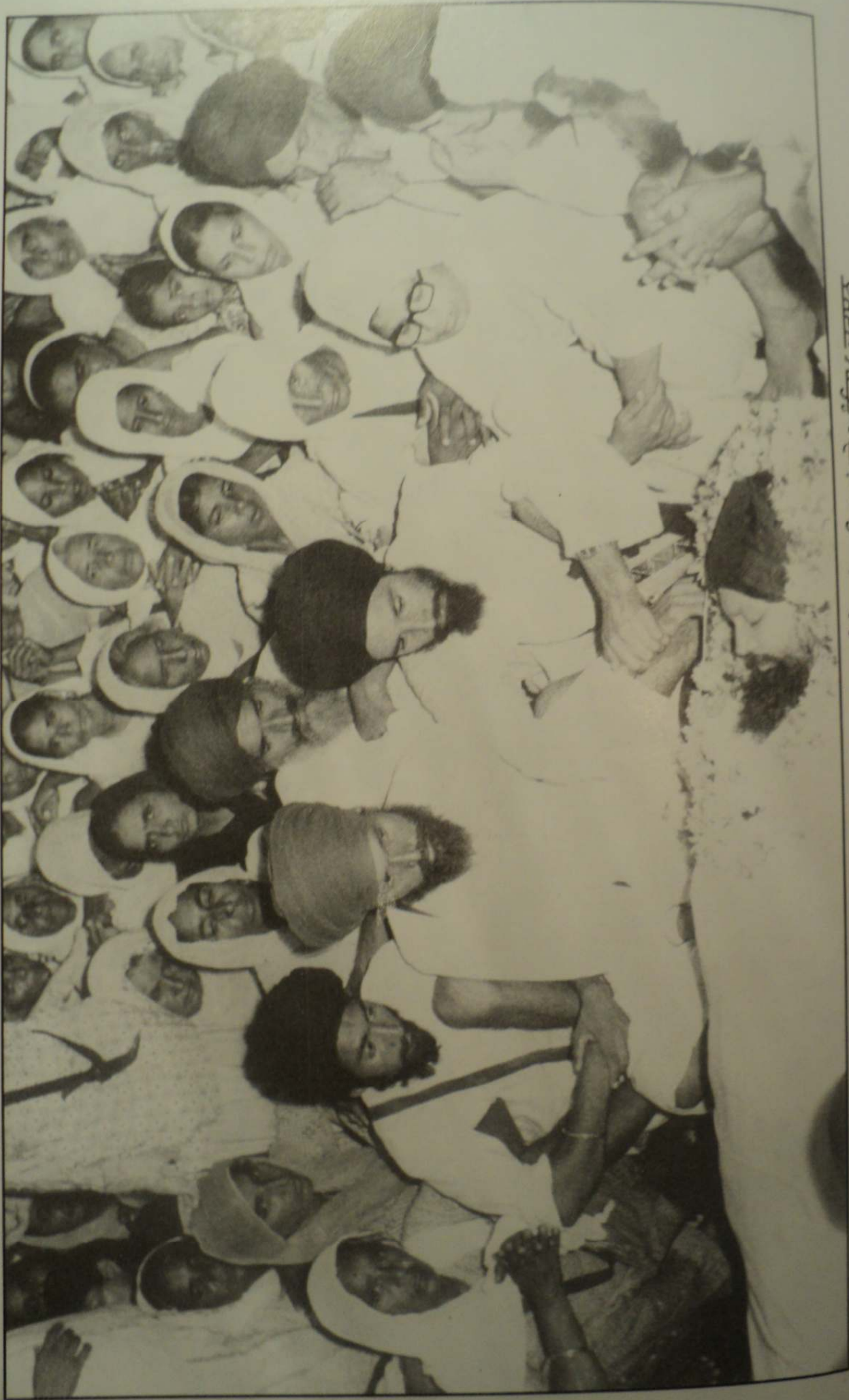
ਸੰਤ ਗਿਆਨੀ ਕਰਤਾਰ ਸਿੰਘ ਜੀ ਖਾਲਸਾ ਭਿੰਡਰਾਂਵਾਲਿਆਂ ਦੇ ਅੰਤਿਮ ਦਰਸ਼ਨ