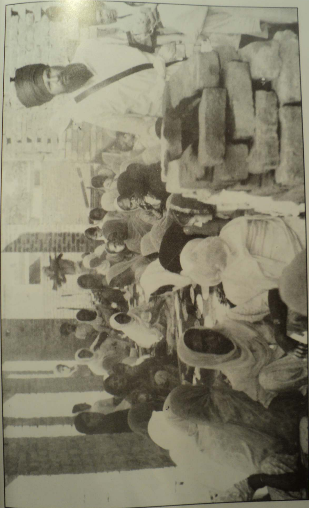
ਮਹਾਂਪੁਰਖ ਲੰਗਰ ਵਿਚ ਸੇਵਾ ਕਰਦੇ ਹੋਏ