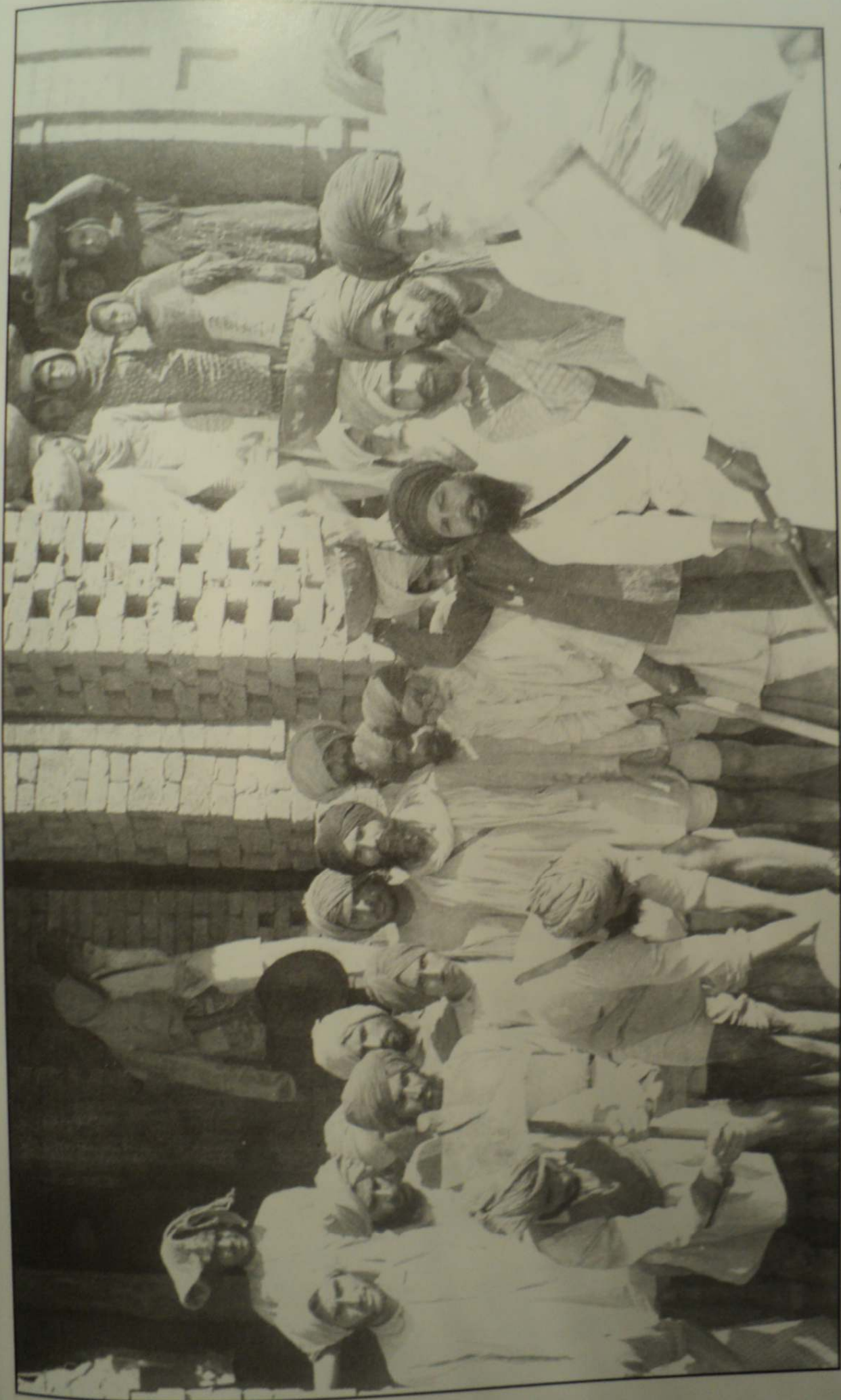
ਗੁਰਦੁਆਰਾ ਗੁਰਦਰਸ਼ਨ ਪ੍ਰਕਾਸ਼ ਮਹਿਤਾ ਦੀ ਕਾਰ ਸੇਵਾ ਦੌਰਾਨ ਮਹਾਂਪੁਰਖ ਸੰਗਤਾਂ ਨਾਲ ਸੇਵਾ ਕਰਦੇ ਹੋਏ