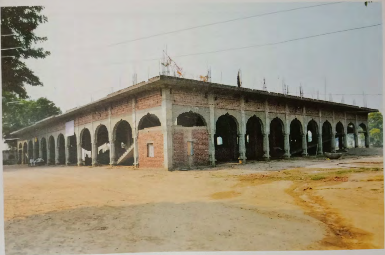
ਲੰਗਰ ਹਾਲ ਦੀ ਇਮਾਰਤ