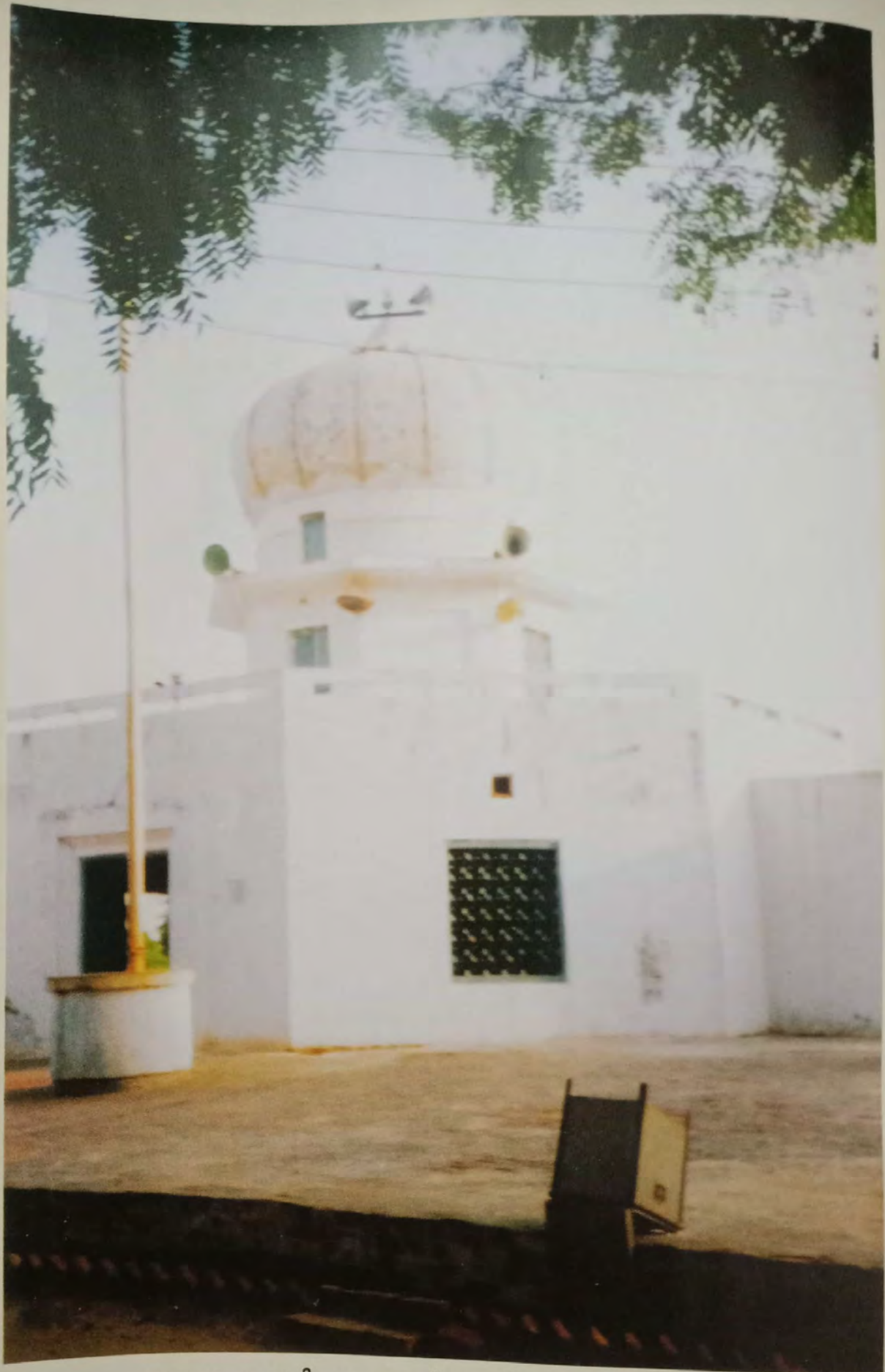
ਗੁਰਦਵਾਰਾ ਗੁੰਗਸਰ ਸਾਹਿਬ ਦੀ ਪੁਰਾਤਨ ਇਮਾਰਤ