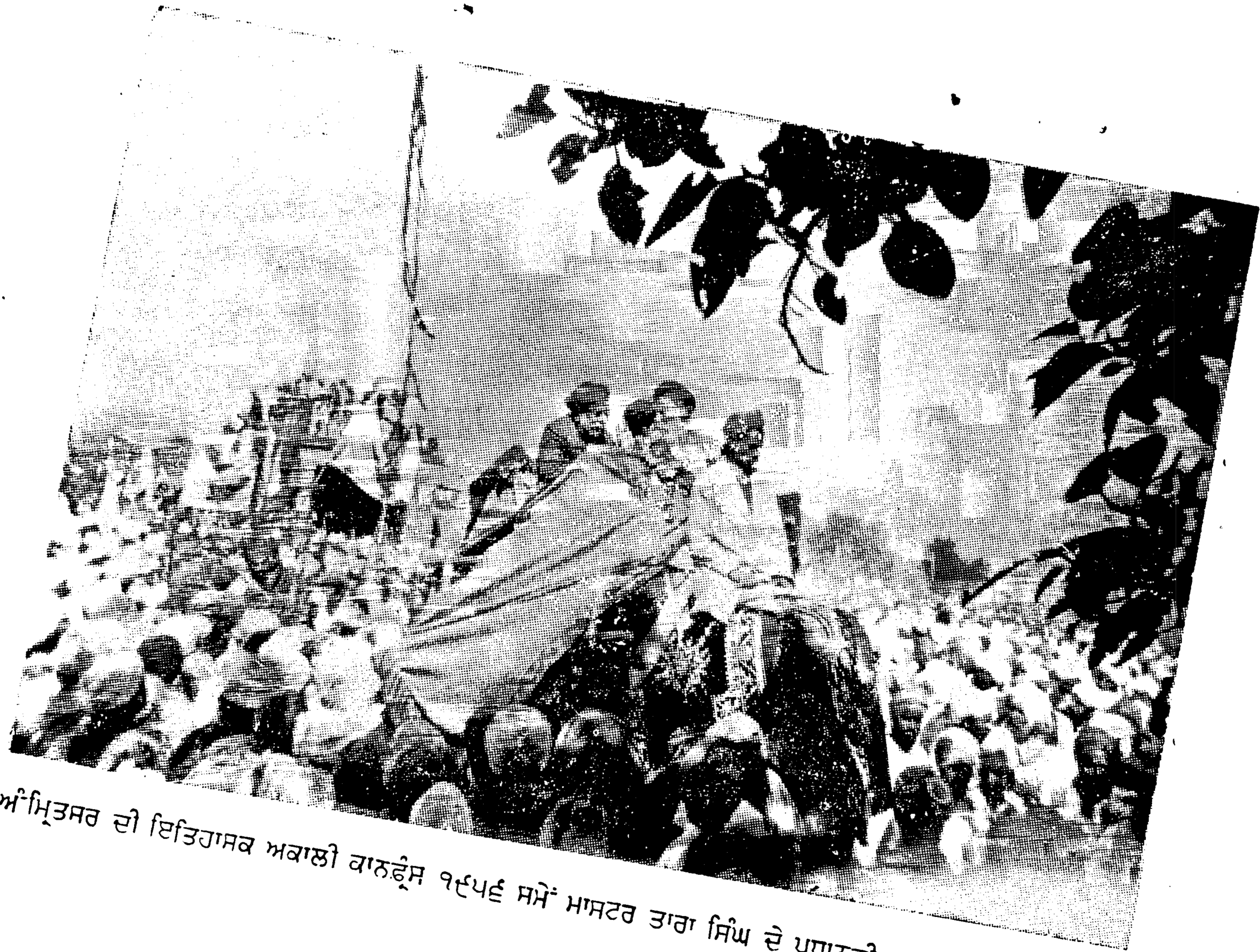
ਅੰਮ੍ਰਿਤਸਰ ਦੀ ਇਤਿਹਾਸਕ ਅਕਾਲੀ ਕਾਨਫ਼ਰੰਸ ੧੯੫੬ ਸਮੇਂ ਮਾਸਟਰ ਤਾਰਾ ਸਿੰਘ ਦੇ ਪ੍ਰਧਾਨਗੀ ਜਲੂਸ ਦਾ ਇਕ ਦ੍ਰਿਸ਼ ।