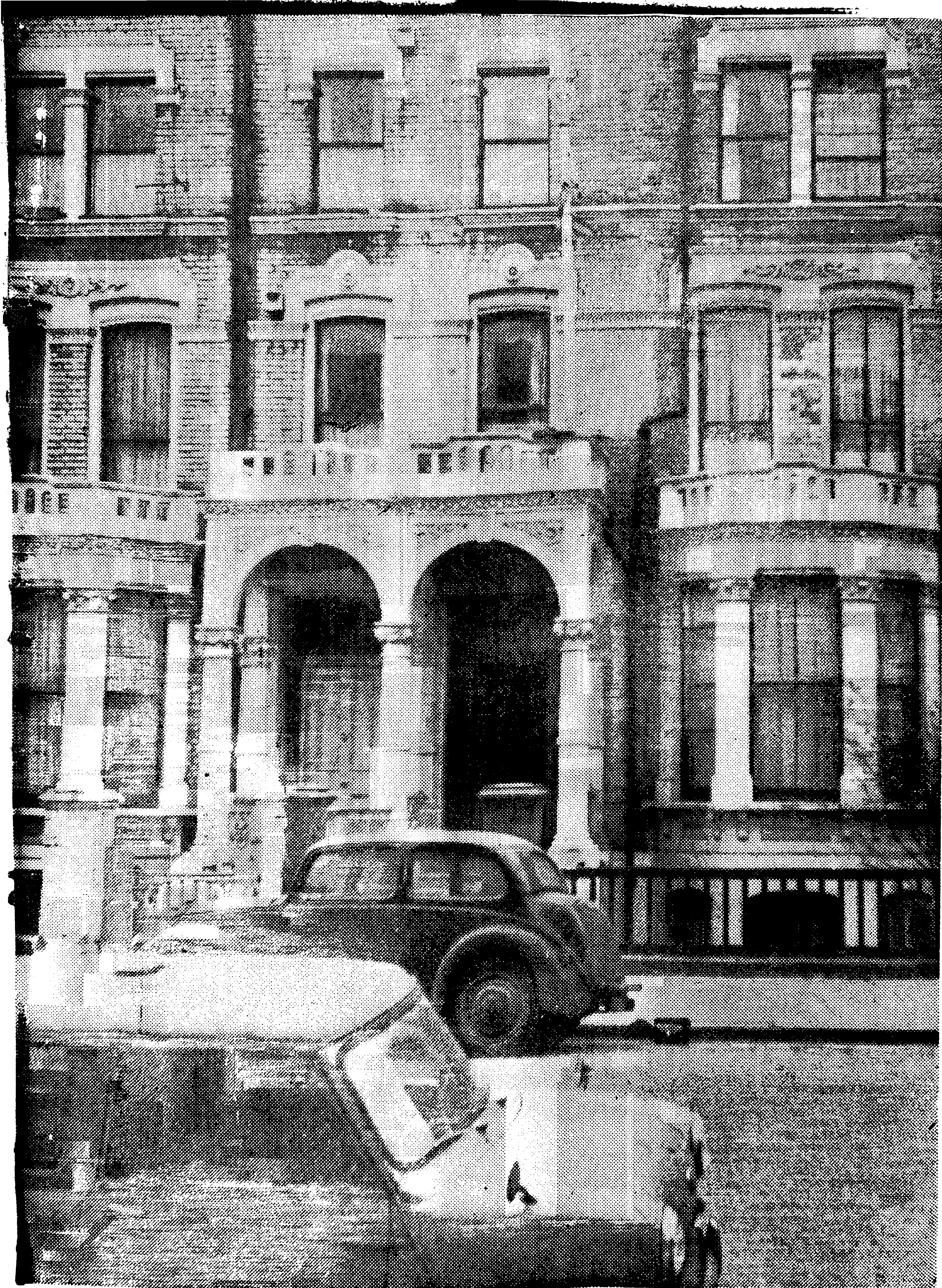
ਭੂਪਿੰਦਰਾ ਧਰਮਸਾਲਾ ਲੰਡਨ ਦਾ ਸਾਹਮਣਾ ਦਿਸ਼