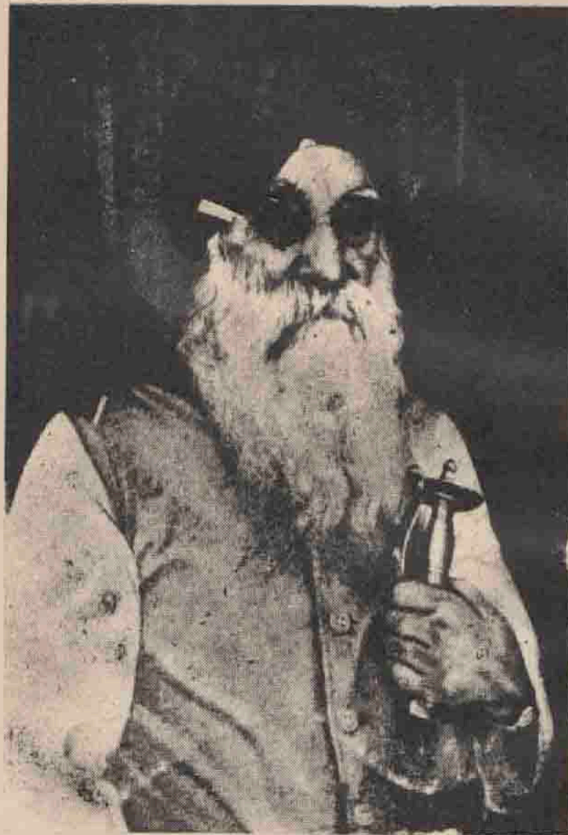
ਮਾਸਟਰ ਤਾਰਾ ਸਿੰਘ