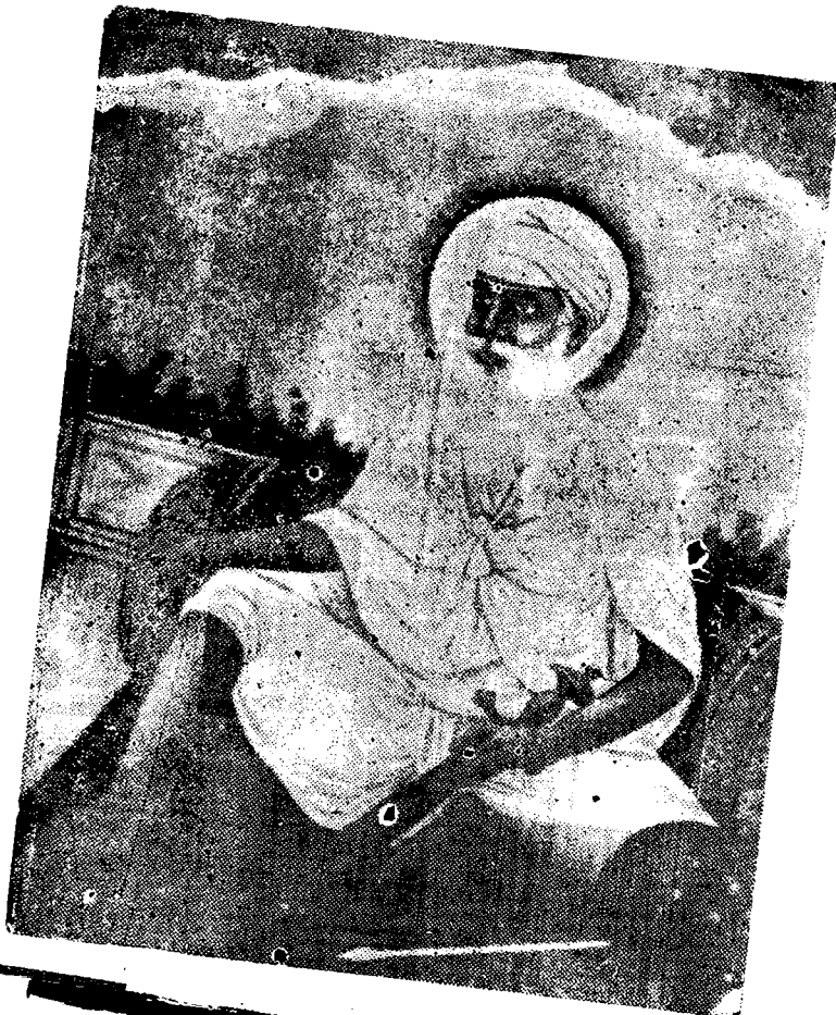
ਬਾਬਾ ਆਲਾ ਸਿੰਘ